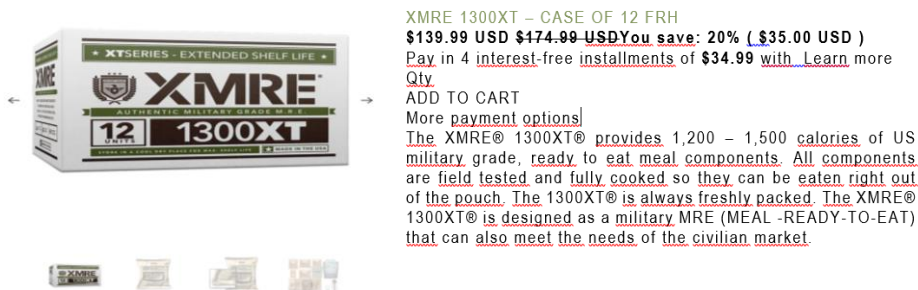
Imagen n.º 1 Precio de la caja del producto “XMRE 1300XT” según la página web de la marca XMRE

Asimismo, en el informe n.º 126-2023-CCFFAA/OA/ULOG indicó “(...) no existen raciones de campaña de un costo menor a US$ 15,00 (...) en planta bajo condiciones EXW 28 (recogidos en planta del fabricante, fletes e impuestos aparte). De hecho, el precio medio de las raciones de campaña antes de la pandemia era de media US$ 18,60 (...) y nosotros las hemos comprado a un precio muy similar que además está aliado con los precios recientes obtenidos por otras entidades”. Sin embargo, de la revisión realizada por la Comisión de Control a la página web https://xmremeals.com 29 , de la marca internacional “XMRE” 30 , se constató que el precio por caja del producto “XMRE 1300XT”, que contiene 12 sobres de raciones de campaña es de US$ 139,99 dólares americanos, tal como se detalla en la imagen siguiente; siendo el precio unitario US$ 11,67 dólares americanos , que corresponde a raciones cuya cantidad de calorías varía de 1 210 a 1 310.