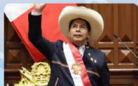
JOSÉ PEDRO CASTILLO TERRONES Periodo Presidencial 2021-2022