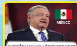
ANDRÉS MANUEL LÓPEZ OBRADOR Periodo Presidencial 2018-2024

REFORMA CURRICULAR ESCOLAR IDEOLOGÍA POLÍTICA