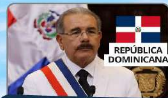
DANILO MEDINA SÁNCHEZ Presidente de la República Dominicana (2012-2016) (2016-2020)

Procuraduría Especializada de Persecución de la Corrupción Administrativa (PEPCA)