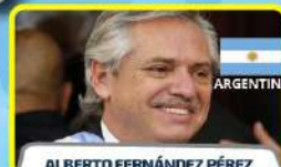
ALBERTO FERNÁNDEZ PÉREZ Periodo Presidencial 2019-2023

REFORMA CURRICULAR ESCOLAR IDEOLOGÍA POLÍTICA