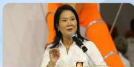
KEIKO FUJIMORI HIGUCHI Candidata Presidencial