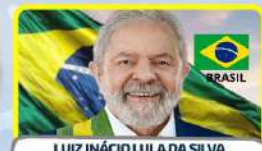
LUIZ INÁCIO LULA DA SILVA Periodo Presidencial 2003-2011 Periodo Presidencial 2023-2027