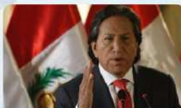
ALEJANDRO TOLEDO MANRIQUE Periodo Presidencial 2001-2006