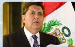
ALÁN GARCÍA PÉREZ Periodo Presidencial 2006-2011