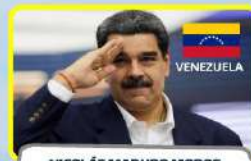
NICOLÁS MADURO MOROS Periodo Presidencial 2013-2023

DEFORMACIÓN ESTADO DE DERECHO ESTADOS DEL CRIMEN ORGANIZADO