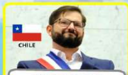
GABRIEL BORIC FONT Periodo Presidencial 2022-2026