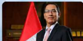
MARTÍN VIZCARRA CORNEJO Periodo Presidencial 2018-2020