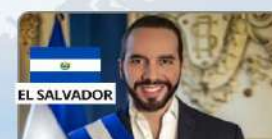
NAYIB BUKELE Presidente de El Salvador (2019-) ¿?¿?¿?¿?¿?¿?¿?¿?¿?¿?¿?¿?