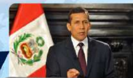
OLLANTA HUMALA TASSO Periodo Presidencial 2011-2016