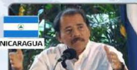
DANIEL ORTEGA Presidente de Nicaragua (2007-) Corrupción y asilo a corruptos extranjeros