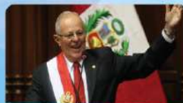
PEDRO PABLO KUCZYNSKI Periodo Presidencial 2016-2018