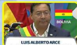
LUIS ALBERTO ARCE Periodo Presidencial 2020-2025

DEFORMACIÓN DE LA ECONOMÍA CON ACTOS CORRUPCIONALES BONOS EXTRAORDINARIOS AGOTAMIENTO DE RESERVA