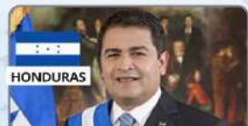
JUAN ORLANDO HERNÁNDEZ ALVARADO Expresidente de Honduras (2014-2022) Caso de tráfico internacional de cocaína.