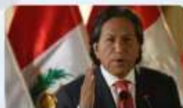
ALEJANDRO TOLEDO MANRIQUE Periodo Presidencial 2001-2006