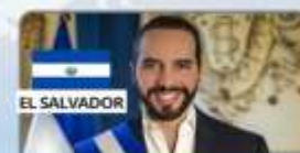
NAYIB BUKELE Presidente de El Salvador (2019-) Corrupción