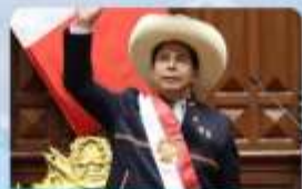
JOSÉ PEDRO CASTILLO TERRONES Periodo Presidencial 2021-2022