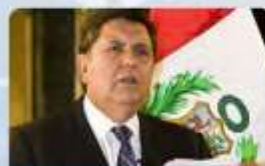
ALÁN GARCÍA PÉREZ Periodo Presidencial 2006-2011