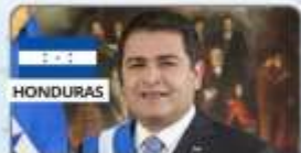
JUAN ORLANDO HERNÁNDEZ ALVARADO Expresidente de Honduras (2014-2022) Caso de tráfico internacional de cocaína.