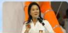
KEIKO FUJIMORI HIGUCHI Candidata Presidencial