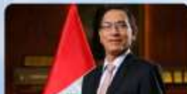
MARTÍN VIZCARRA CORNEJO Periodo Presidencial 2018-2020