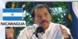
DANIEL ORTEGA Presidente de Nicaragua (2007-) Corrupción y asilo a corruptos extranjeros