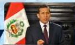
OLLANTA HUMALA TASSO Periodo Presidencial 2011-2016