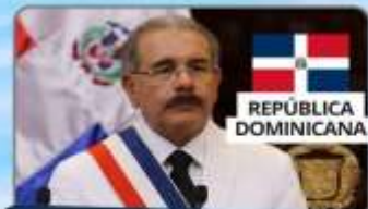
DANILO MEDINA SÁNCHEZ Presidente de la República Dominicana (2012-2016) (2016-2020)

Procuraduría Especializada de Persecución de la Corrupción Administrativa (PEPCA)